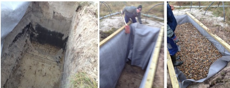
De to dræn på Jeppesvej ved P-pladsen.