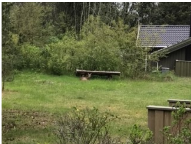
Bambi venter på sin mor på Jeppesvej...

Jeg cykler hjem ad Guldvangen og tænker: Hvor er det dog dejligt at være fælles om den samme begejstring for dette skønne område.