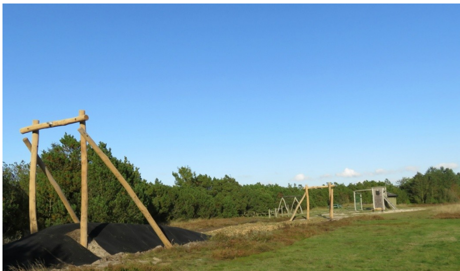
Nye flotte redskaber på legepladsen ved Jeppesvej.