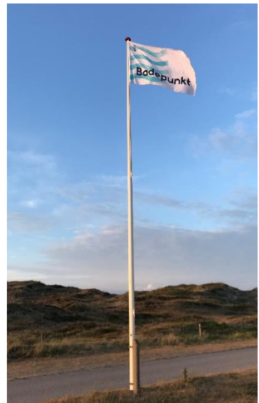
Badepunktflag ved Houstrup Strand