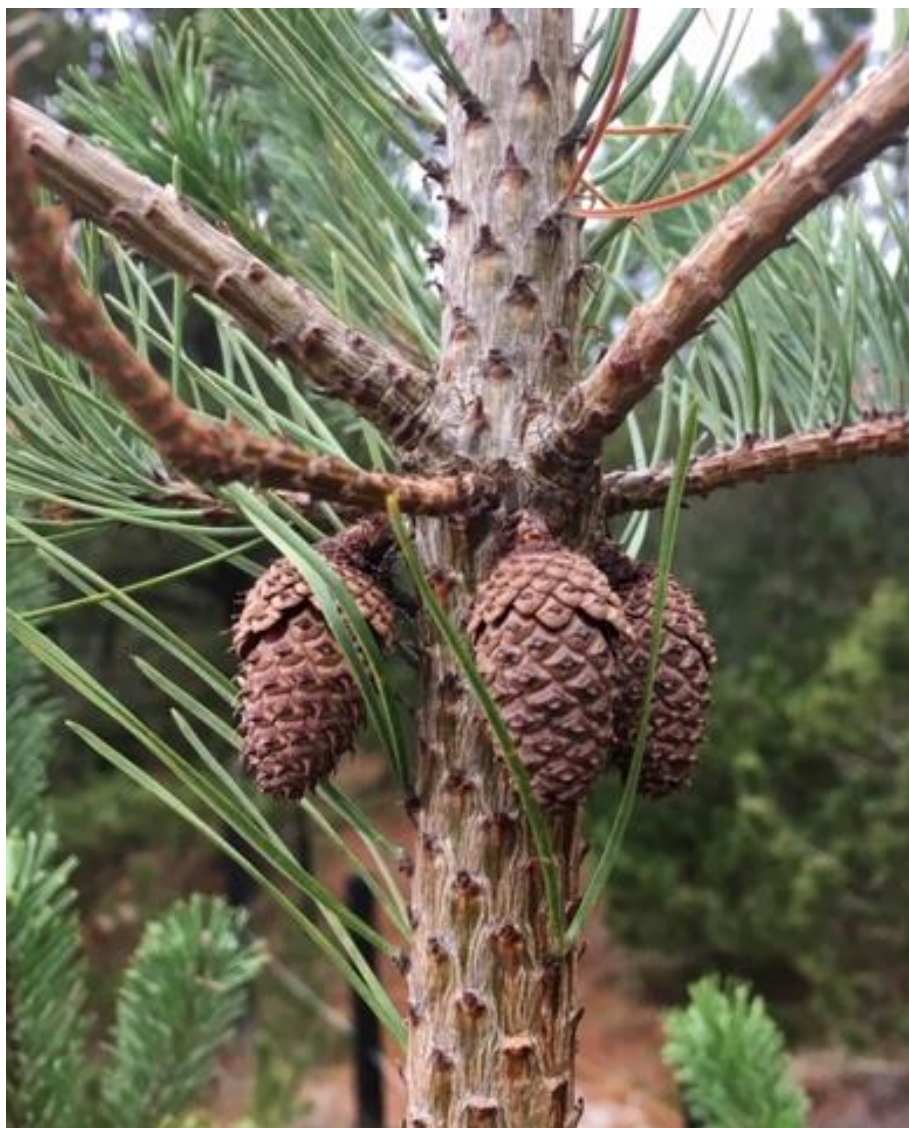
Nye kogler på nåletræerne.

Medlemsblad for grundejerforeningen Guldvangen 39. årgang nr. 145 december 2018