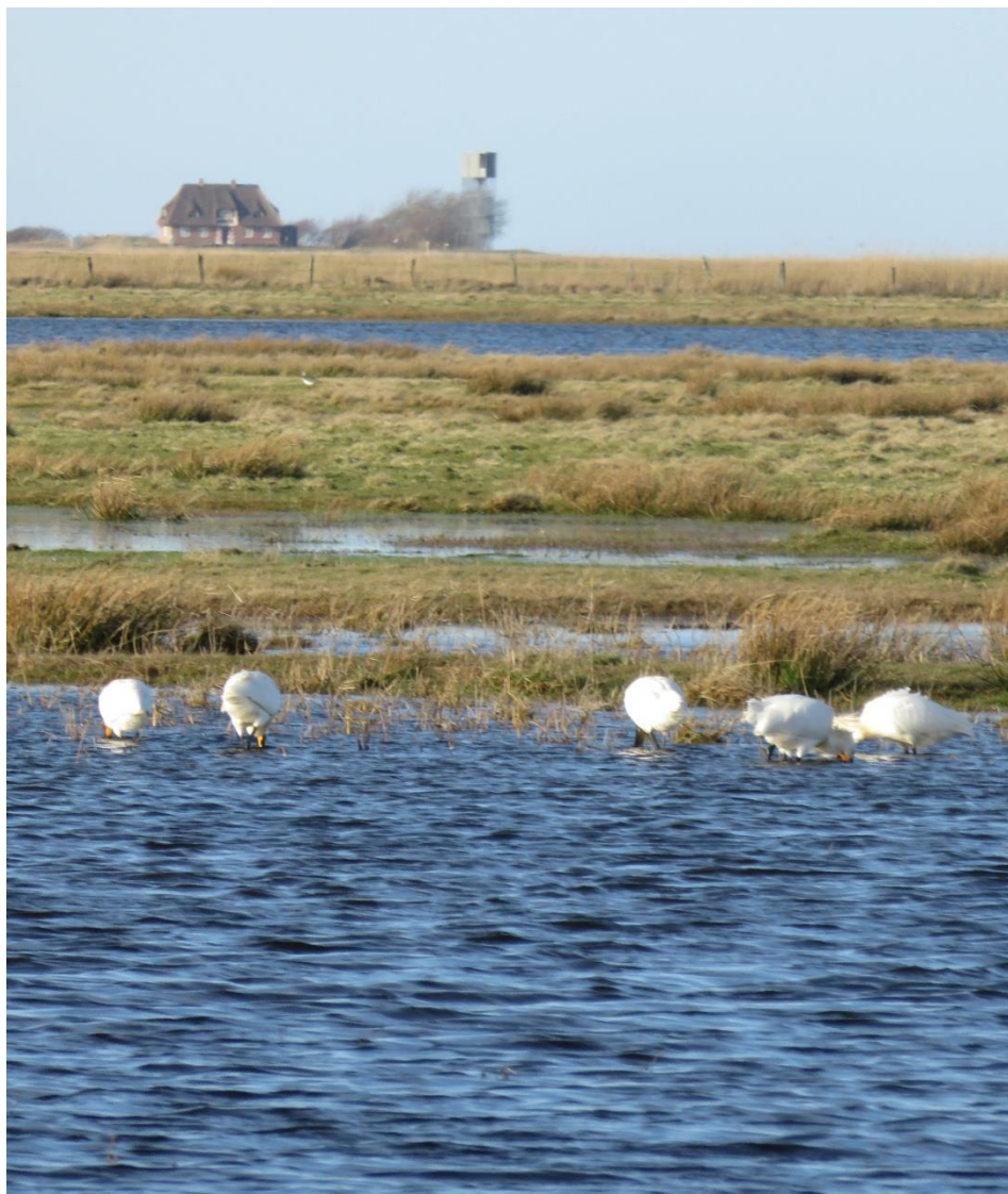
Skestorken besøger Tipperne.

Medlemsblad for grundejerforeningen Guldvangen 40. årgang nr. 146 marts 2019