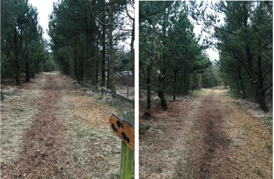
Nydeligt klippede stier i fællesområderne – det giver lys og plads.

Egon lovede at sende et par billeder til bladet fra stierne.