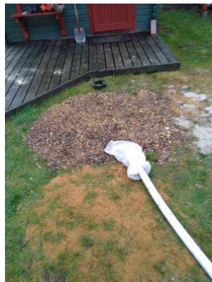
En sugestav monteres i ca. 1 m dybde og sænker vandstanden via en pumpe, når grunden oversvømmes.