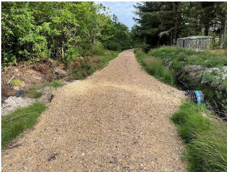
Dræn og ny belægning på Hundevejen langs Hundevejsgrøften.