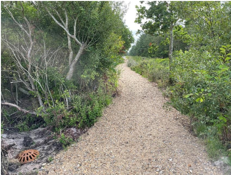
Dræn og ny belægning på stien fra P-pladsen for enden af Guldvangen.

Næste møde blev foreslået til 27. august kl. 14.00 på Jeppesvej 66.