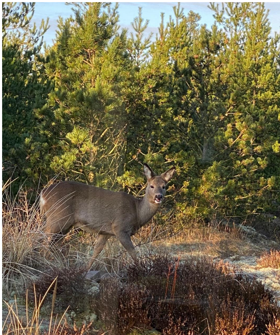
Fint besøg på Hans Hansensvej en tidlig sommermorgen.