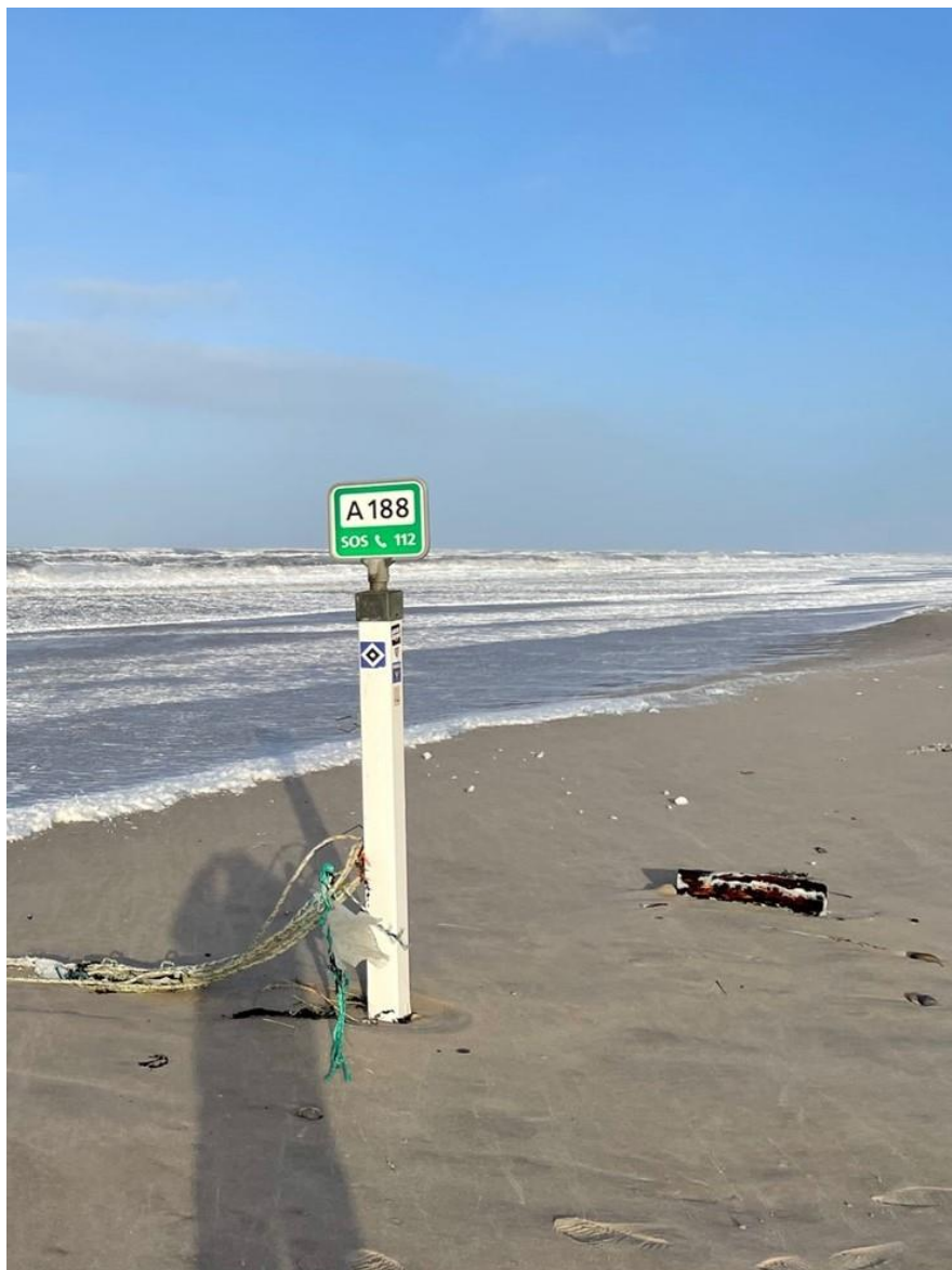
Forårsblæsevej nord for Houstrup Strand ved Redningsnummer A188.