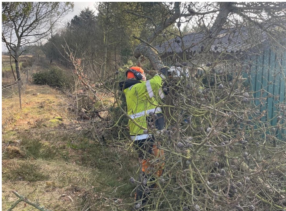
Der arbejdes ihærdigt beskæring af træer og buske i vores område.

Næste møde er på dagen for generalforsamling den 19. april 2025 kl. 08.30 i hallen.