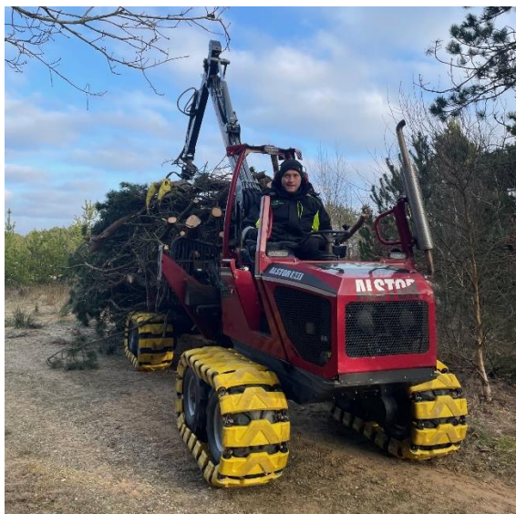
Den lille skovmaskine rydder træer og buske langs Kirkeflodsgrøften og er forberedelse til oprensning/vedligehold.